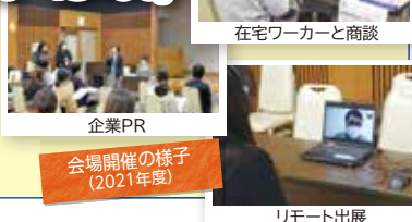
在宅ワーカーと商談